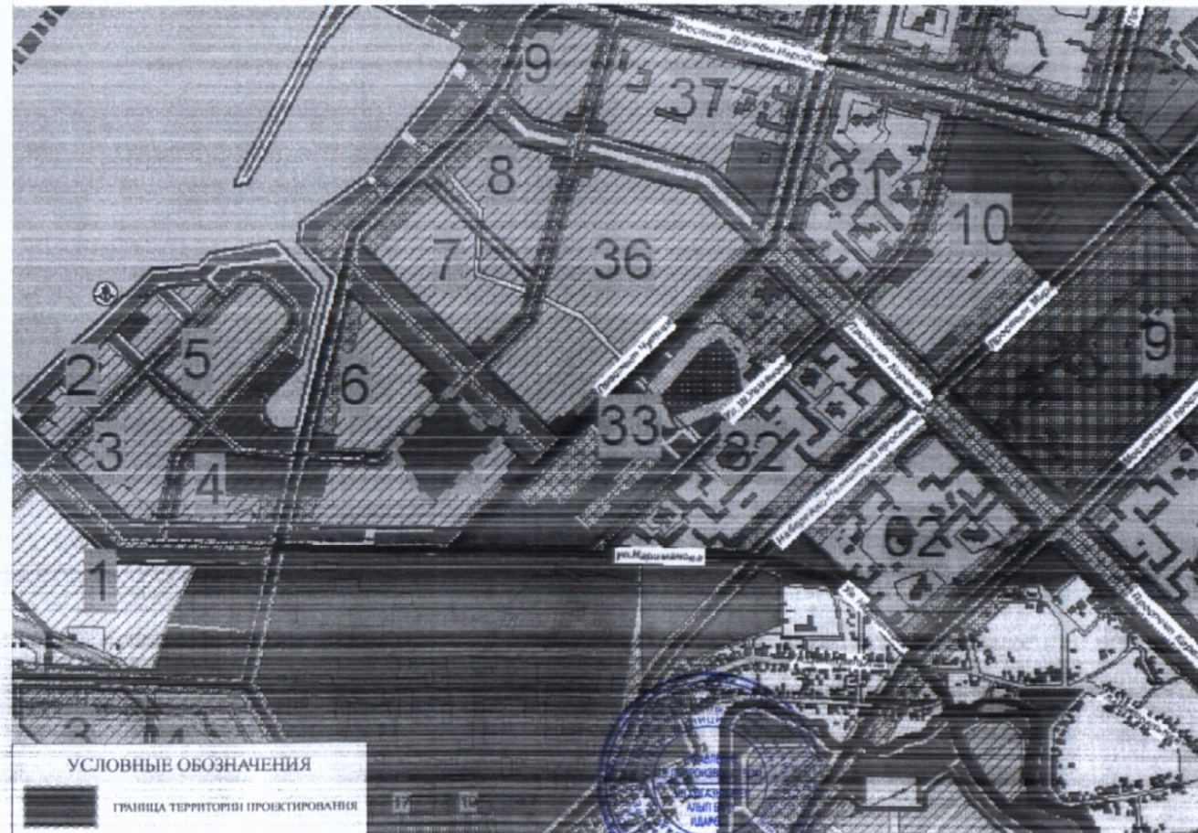
СХЕМА РАЗМЕЩЕНИЯ ТЕРРИТОРИЙ ПРОЕКТИРОВАНИЯ В СТРУКТУРЕ ГОРОДА СОГЛАСНО ГЕНЕРАЛЬНОГО ПЛАНА

Руководитель Аппарата Исполнительного комитета